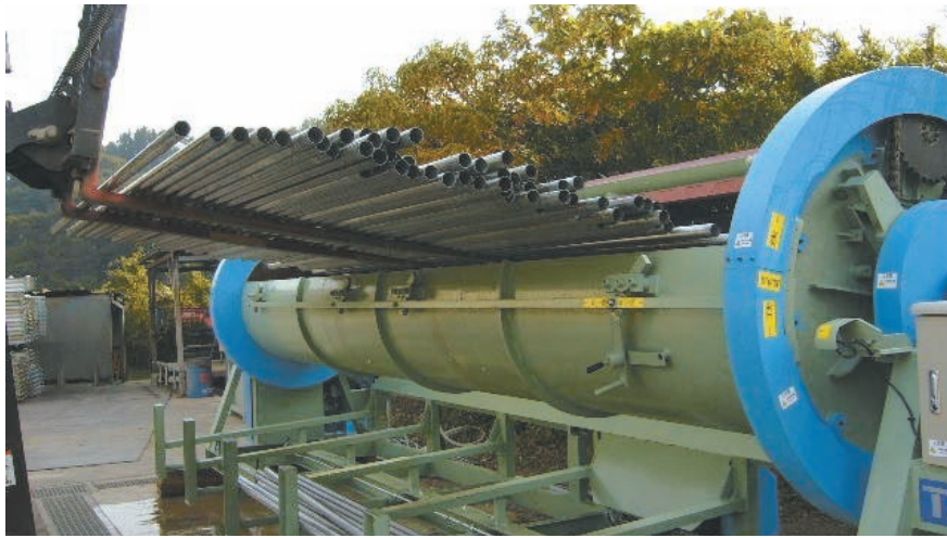
ワーク投入イメージ

● 操作が簡単 ボタン操作で扉を自動開閉 フォークリフトでの投入・排出を可能にしました