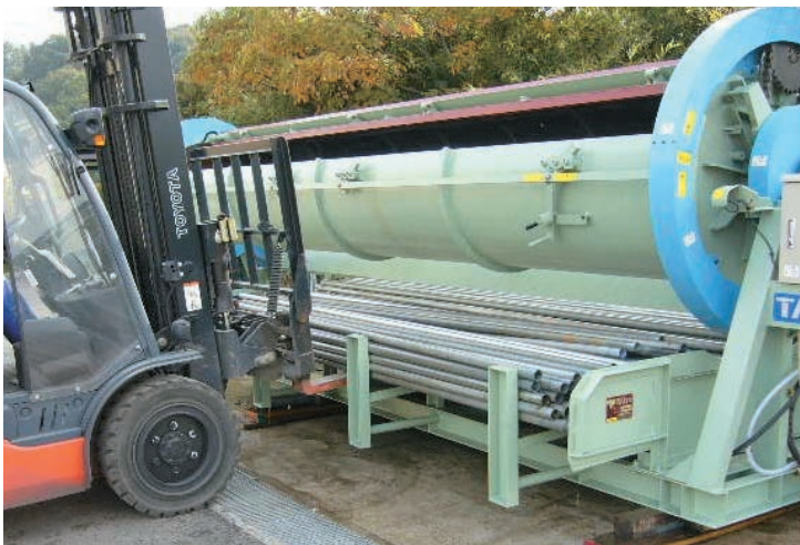
ワーク排出イメージ